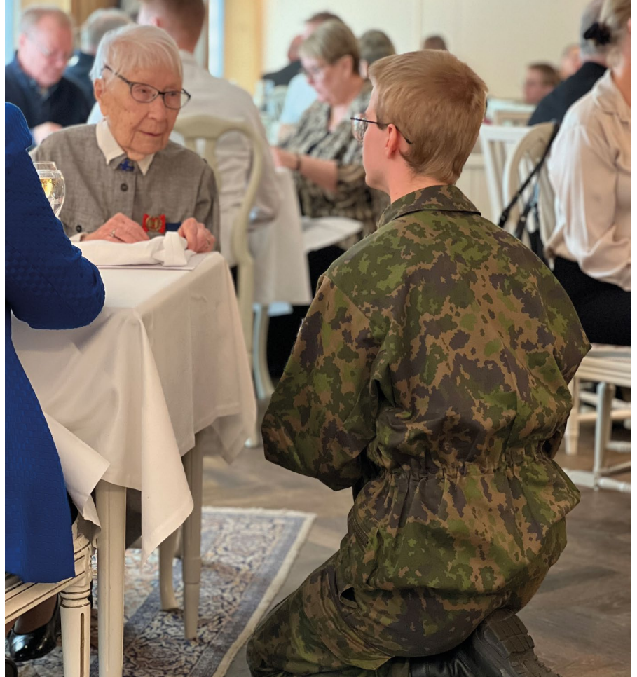
Ruotuväki-lehden toimittaja polvistui päivänsankarin eteen Vuoden Lotta 2024 -tilaisuudessa.