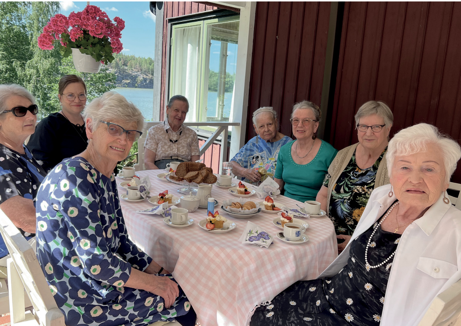
Lottia Ruotsin Majalla kesäloman vietossa.

Raha-avustusta sai yhteensä 505 lottaa tai pikkulottaa.