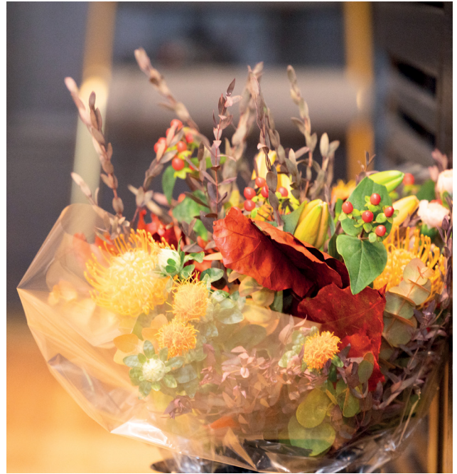
Lotta Svärd Säätiöstä lähetettiin kukkia kaikille sata vuotta tai enemmän täyttäneille lotille.

Lotta Svärd Säätiö lahjoitti toimintavuonna omaisten pyynnöstä hautareliefit edesmenneiden lottien ja pikkulottien hautakiviin. Kaikille 100 vuotta tai enemmän täyttäneille lotille ja pikkulotille on lähetetty kukkatervehdys toimintavuoden aikana. Kukkalähetyksiä lähetettiin yhteensä 14 289,30 euron arvosta.