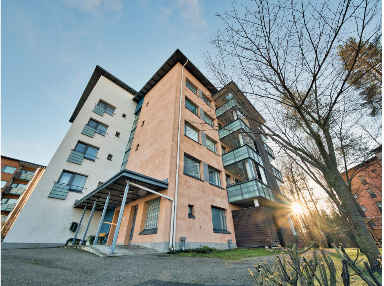
Vuonna 2002 valmistuneessa Asunto Oy Tuusulan Lottakodissa on 21 senioreille soveltuvaa asuntoa.