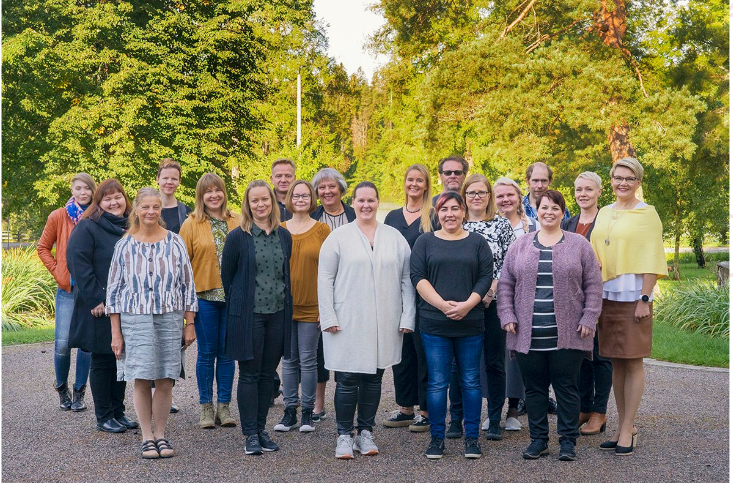
Lotta Svärd Säätiökonsernin palveluksessa on yhteensä 27 henkilöä. Kuvassa Lotta Svärd Säätiön henkilökuntaa syksyllä 2020 Lottamuseolla.

Vuonna 2020 Lotta Svärd Säätiö-konsernin palveluksessa oli yhteensä 27 henkilöä. Työtehtävät sijoittuvat hallinto- museo- kanttiini- ja kiinteistön ylläpitotehtäviin.