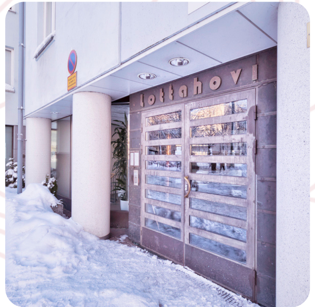
Asuntotoimikunnan tehtävänä on huolehtia sekä kiinteistöjen kunnosta että asukastyytyvyydestä.

Avustustoimikunta kokoontui tilikauden aikana 12 kertaa.