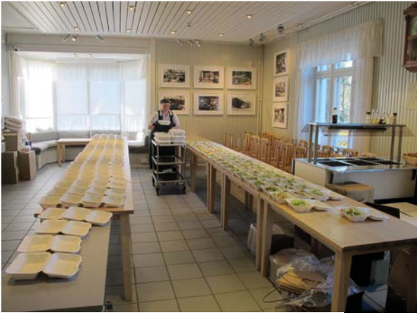
Lottakanttiin lounaskuljetuksia valmistellaan. Poikkeusoloihin mukautuminen tapahtui nopeasti.

Lottakanttiinissa toteutettiin uudenlaista toimintaa, kun koronapandemiasta johtuva ravintoloiden sulkeminen käynnisti lounaiden nouto- ja kuljetuspalvelun maaliskuussa. Palvelu muodostui nopeasti suosituksi. Erityisesti palveltiin riskiryhmään kuuluvia ikäihmisiä. Toimitimme kevään poikkeustilan ajan lounaat alueen sotaveteraaneille ja sotainvalideille sekä heidän puolisoilleen yhteistyössä paikallisten veteraanijärjestöjen kanssa. Lotta Svärd Säätiö avusti veteraanijärjestöjä veteraanien lounaiden kustannuksissa.