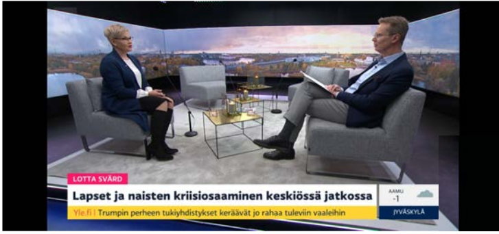
Lähestyvä juhlavuosi kiinnosti myös mediaa. Kuva Ylen Aamu-lähetyksestä 4.12.2020