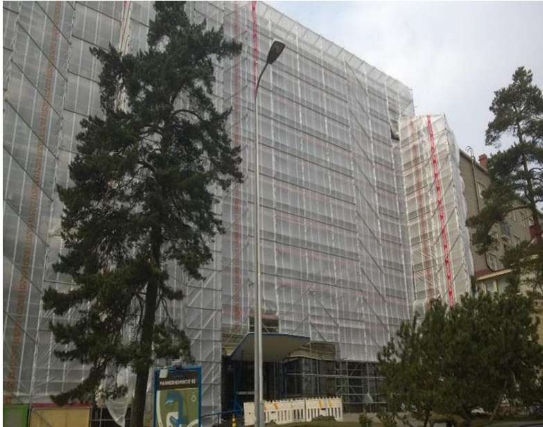
As Oy Mannerheimintie 93 julkisivusaneeraus meneillään.