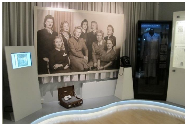
Mitä jälkeen jää – Lakkautettu Lottajärjestö

Lottamuseon kolmessa verkkonäyttelyissä vieraili 18 835 kävijää ja kotisivuilla oli kaikkiaan yli 36 000 vierailijaa.