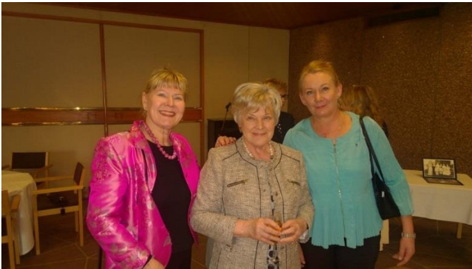
Ministeri Elisabeth Rehnin 80-vuotispäivät Hanasaarella 8.4.2015