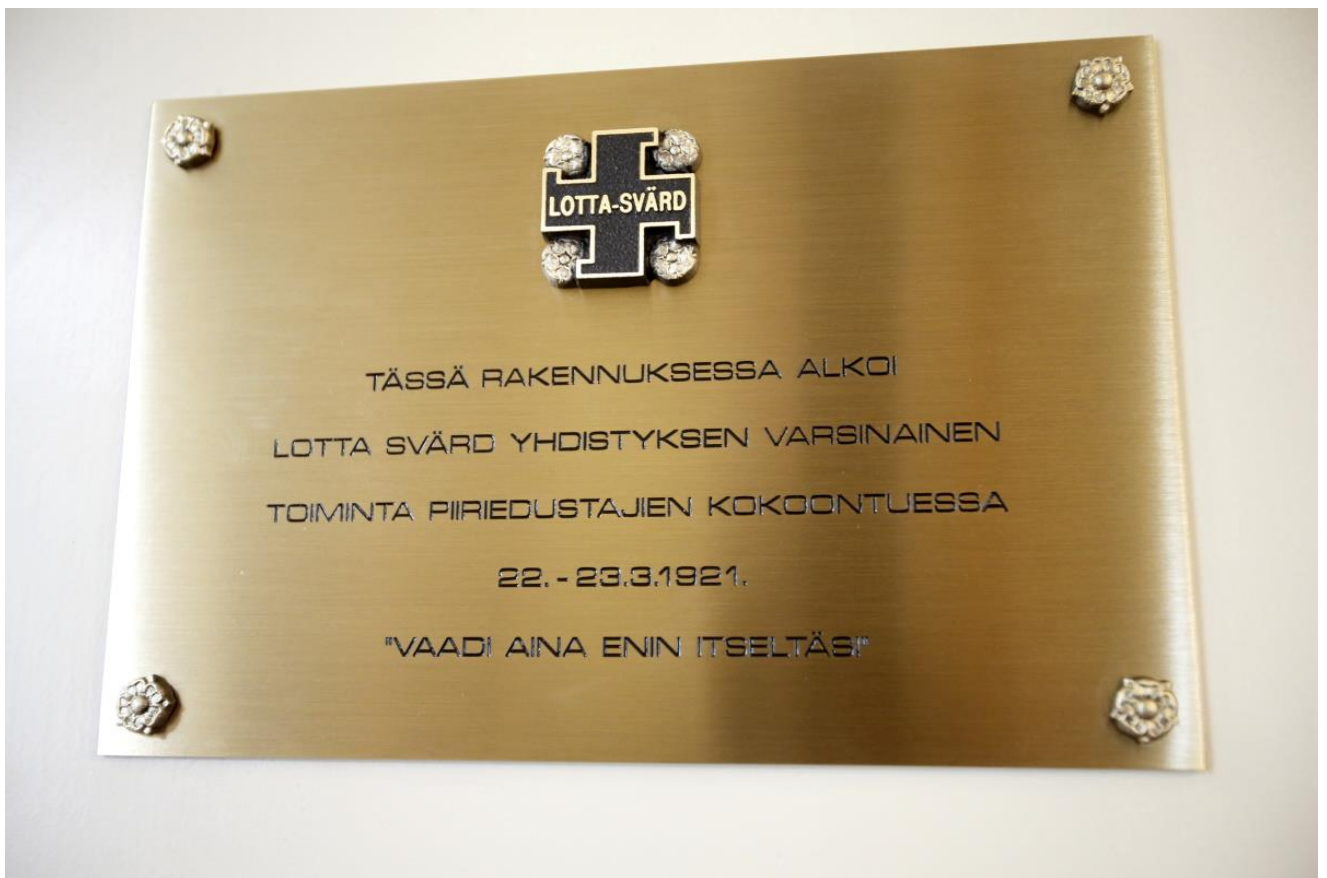
Lotta Svärd yhdistyksen perustamisen muistolaatan julkistaminen Katajanokan kasinolla 12.9.2014

Tämä toimintakertomus ja tasekirja on säilytettävä 31.12.2024 saakka