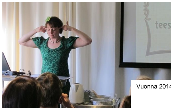
Vuonna 2014 lanseerattiin Kauneutta kotikonstein -työpaja.

Lottakanttiin avajaisten yhteydessä lanseerattiin aikuisille suunnattu työpaja Kauneutta kotikonstein. Erittäin suosittu työpaja vie 1930-luvun kauneudenhoidon maailmaan ja avaa tätä kautta naisten historiaa.