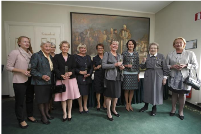
Tasavallan Presidentin puoliso, rouva Jenni Haukio julkisti 12.9.2014 Katajanokan Kasinolla Lotta Svärd yhdistyksen perustamisen muistolaatan. Kuvassa rouva Haukio säätiön hallituksen kanssa.