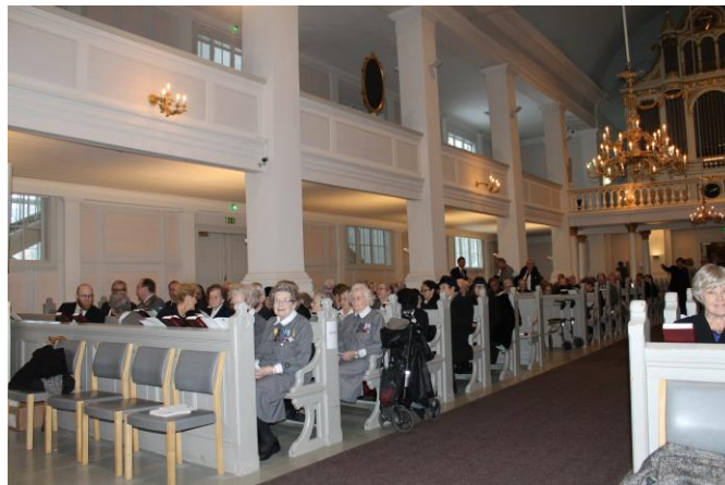
Lotta Svärd yhdistyksen lakkauttamisen muistojumalanpalvelus Helsingin vanhassa kirkossa 23.11.2014.