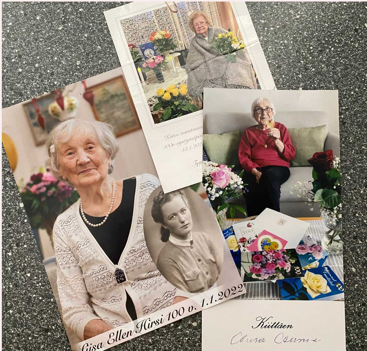
Lotta Svärd Säätiö muistaa kaikkia 100 v ja enemmän täyttäviä lottia kukkatervehdyksellä. Kukkatervehdyksiä lähetettiin vuonna 2022 yli 200:lle lotalle tai pikkulotalle.