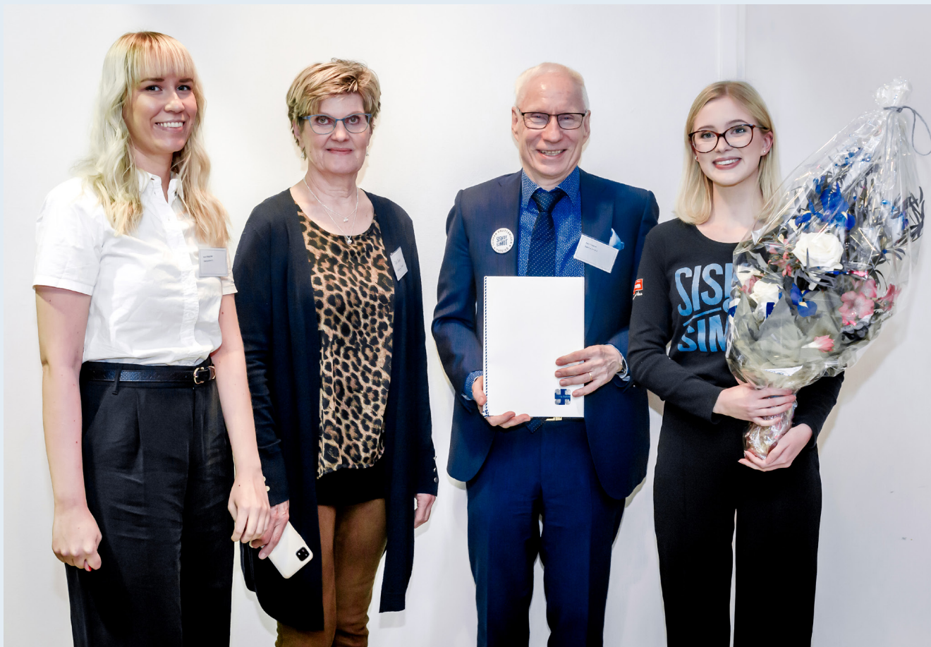
Ensimmäisen Lotta Svärd -stipendin saaja Siskot ja Simot Ry vastaanotti palkinnon Lotta Svärd -seminaarissa 24.10.2022.