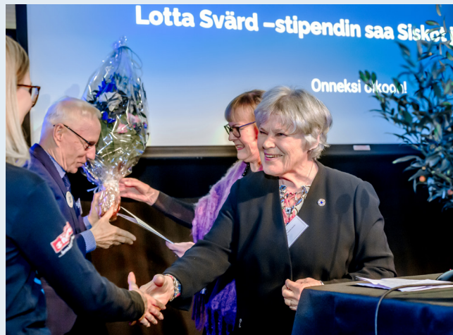
Ministeri Elisabeth Rehn luovutti historian ensimmäisen Lotta Svärd-Stipendin Siskot ja Simot Ry:lle.

Stipendi myönnetään tästä eteenpäin vuosittain Suomen Naisten Huoltosäätiön perustamispäivänä 24.10.