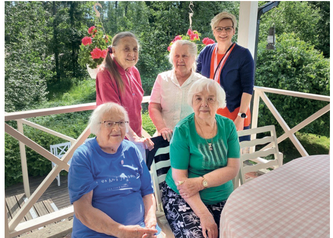
Kesätoimintaa Ruotsin Majalla.

”Lottakuntoutuksia ja -avustuksia on maksettu vuosina 1997–2022 yhteensä 57,8 miljoonaa euroa.”