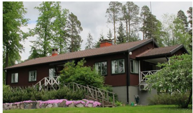
Ruotsin Maja sijaitsee Tuusulanjärven rannalla.