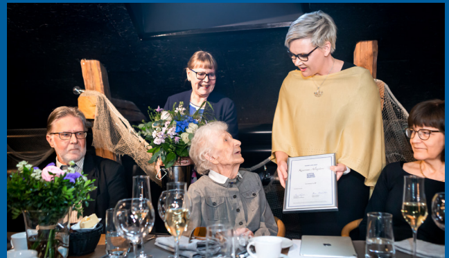
Vuoden Lotta palkittiin Lotan päivänä 12.5. 2022.